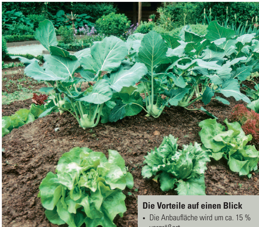
Um die Bearbeitung eines Hügelbeetes zu erleichtern, werden hoch wachsende Pflanzen in die Beetmitte, niedrig wachsende Pflanzen an den Beetrand gepflanzt

Bei den Verrottungsprozessen im Hügel entsteht Wärme. Hügelbeete können deshalb schon recht früh und besonders gut mit wärmeliebenden Gemüsearten wie Tomaten, Zucchini und Gurken bepflanzt werden. Die vergrößerte Anbaufläche macht Hügelbeete gerade für kleine Gärten interes-