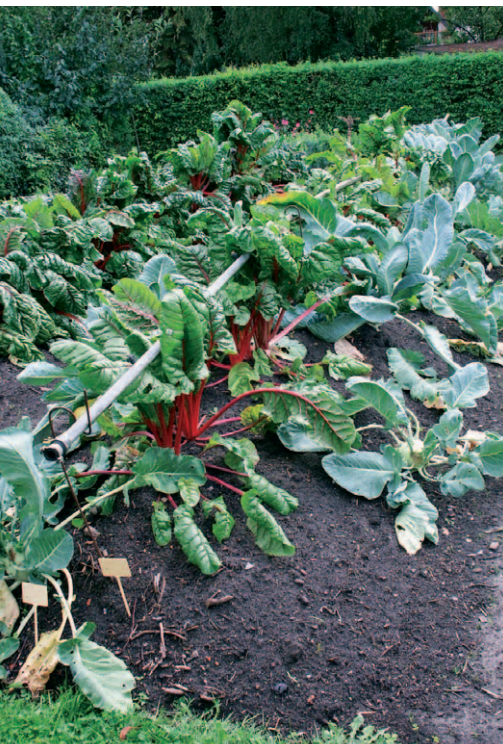
Bei diesem Hügelbeet wurde Mangold mit Kohlrabi kombiniert. Gut zu sehen ist der über der Gießrinne angebrachte Bewässerungsschlauch, der bei Trockenheit die Wasserversorgung sicherstellt.

Bei den Verrottungsprozessen im Hügel entsteht Wärme. Hügelbeete können deshalb schon recht früh und besonders gut mit wärmeliebenden Gemüsearten wie Tomaten, Zucchini und Gurken bepflanzt werden. Die vergrößerte Anbaufläche macht Hügelbeete gerade für kleine Gärten interes-