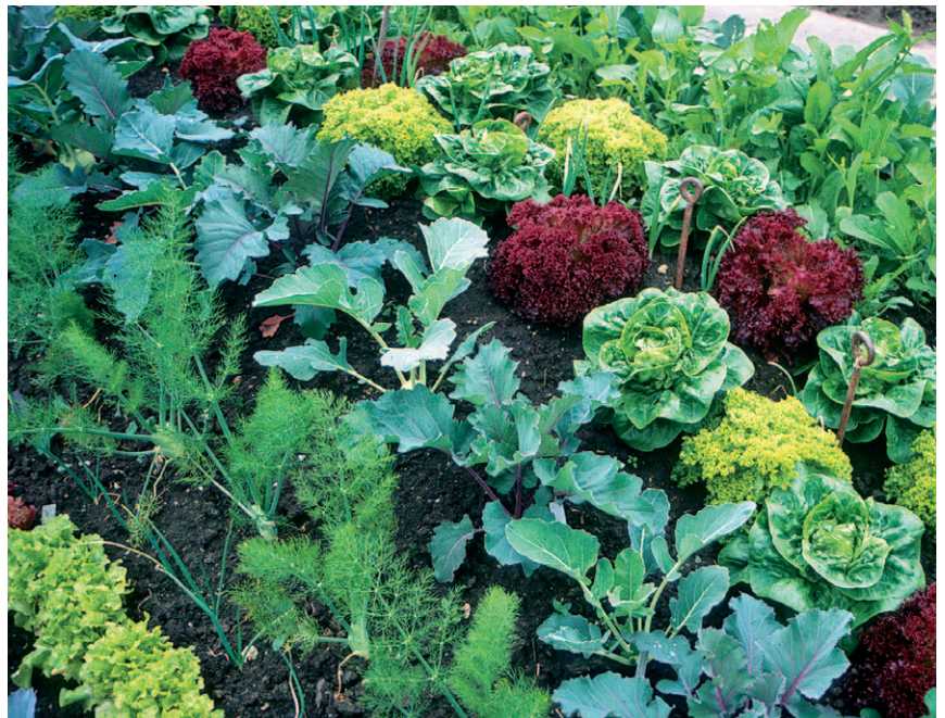
Um gegen Krankheiten und Schädlinge vorzubeugen, empfiehlt es sich, auf einem Hügelbeet Mischkulturen anzupflanzen

Hügelbeete helfen, Abfallprobleme im Garten zu lösen: Besonders das sonst schwer zu verwertende holzige Material kann im Laufe des Jahres gesammelt und zum Anlegen eines Hügelbeetes verwendet werden. Durch die fortlaufenden Verrottungsprozesse des organischen Materials wird eine stetige Humus- und Nährstoffversorgung der auf dem Hügelbeet wachsenden Pflanzen gesichert. Somit können ohne zusätzliche Düngung hohe Erträge erzielt werden.